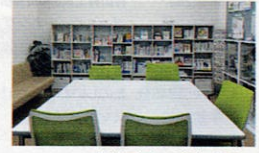
予約不要で、開室時間は午前9時から午後5時まで

保健センター2階「こころとからだの保健室ポルタ」にある「こころの情報コーナー」「がん情報コーナー」では、こころの健康とがんに関する書籍やリーフレットを自由にご覧いただけます(書籍の貸し出しは行っていません)。また、「アピアランスケアの展示コーナー」では、がん治療に伴う外見の変化をカバーするための「ウィッグ」や乳がんの方用の「補整具」などの見本も、実際に手に取れるようになっています。