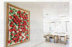
利用者さんが力を合わせて作るアート作品も展示

☎ 東京リハビリテーションセンター世田谷 デイサービスセンター梅ヶ丘 ☎ 03-6379-0609(直通)