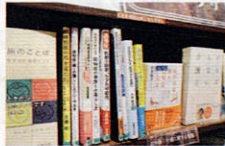
認知症・介護に関する書籍コーナー

認知症在宅生活サポートセンターの入口にある「にんさぼ文庫」には、認知症に関する推薦図書があり、どなたでもご覧いただけます(書籍の貸し出しは行っていません)。にんさぼ文庫の利用時間は、午前8時30分から午後5時までです。ご利用の際は、気軽にお声がけください。また、総合プラザ1階の「図書コーナー」にも、認知症関連の書籍があります。認知症について、本を読んで知識を深めてみませんか。