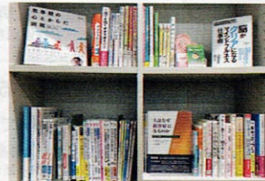
こころに関する書籍コーナー