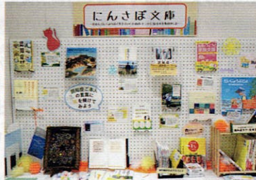
にんさぼ文庫の様子

☎ 世田谷区認知症在宅生活サポートセンター ☎ 03-6379-4315 FAX 03-6379-4316