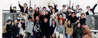
ベトナム、インドネシアやミャンマーなど国籍も多様

区内の福祉事業所で働く外国人職員の交流会を2月12日に開催しました。世田谷区の現状や取組みの話の後、グループに分かれて活発な意見交換が行われました。写真を撮り合い、連絡先を交換するなど交流が深められました。