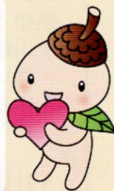
世田谷区社協キャラクター ココロン