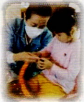
7月 七夕飾りづくり 10月 ハロウィン飾りづくり