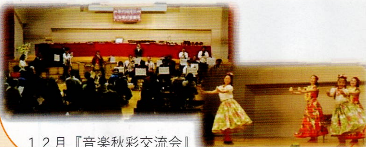
12月 『音楽秋彩交流会』