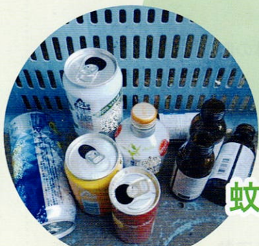
空き缶・空きビン