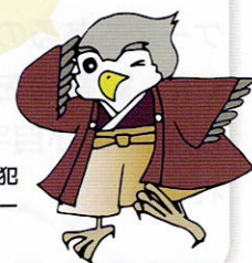
世田谷区防犯キャラクター せたかくん

犯罪が増加しているいま、一人一人が防犯意識を高めることが重要です。手口を知って共有しましょう。