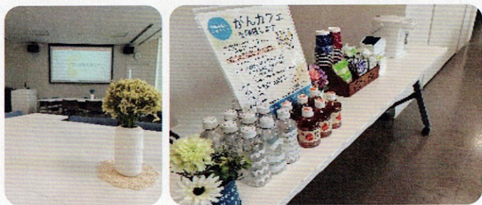
(左) 昨年度の「がんカフェ」の様子 (右) 飲み物を飲みながら語り合いました