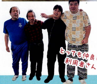
とっても仲良し！利用者さん

地域に開かれた場所であることを大切にしながら、まもりやま工房はこれからも地域のみなさんとともに歩んでいきます。