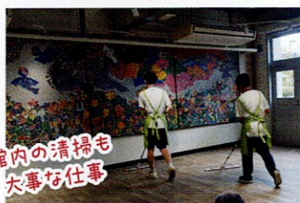
館内の清掃も大事な仕事

焼菓子やコーヒーづくりでは、「お客様に喜んでいただける品質」を大切にしています。衛生管理を徹底し、製造から販売、配達などの工程を利用者が