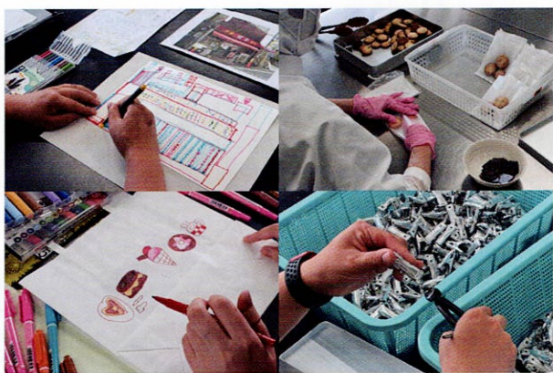
クッキー製造や受託作業、創作活動に取り組んでいます

利用者のみなさんは、クッキーやコーヒーの製造・販売、館内清掃、芝生の育成、受託作業など、さまざまな仕事に取り組んでいます。それぞれの得意なことや興味を生かしながら働き、工賃を得るだけでなく、社会とのつながりややりがいを感じられる場にもなっています。